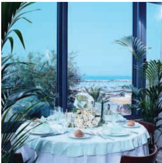
Romantischer Ausblick beim Abendessen