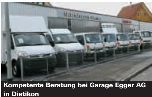
Kompetente Beratung bei Garage Egger AG in Dietikon

Seit 37 Jahren ist die Garage Egger AG in Dietikon der Ansprechpartner für NISSAN-Personenwagen und NISSAN-Nutzfahrzeuge. Vor allem im Bereich bis 3,5 Tonnen Gesamt-