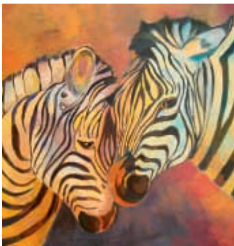
Liebe ist überall. Sie muss sich jedoch nicht immer zeigen. Doch wenn sie es tut, sollte man hinschauen und sich darüber freuen!

in Brugg aufgewachsen und seit 1973 in Neuenhof, malt ganz einfach das, was ihr am Herzen liegt. Schon in der Schule war zeichnen ihr Lieblingsfach. Doch durch den Beruf, die Heirat und das Grossziehen von Kindern geriet die Malerei immer mehr in den Hintergrund.